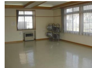
▲ 研修室 1