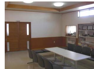
▲ 研修室 3