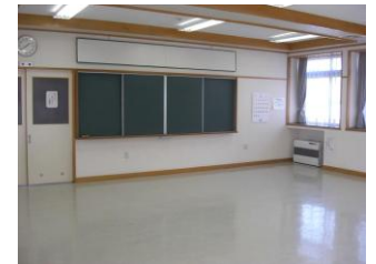
▼ 研修室 2