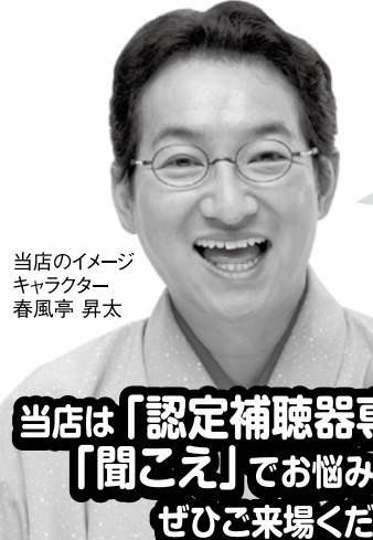
当店のイメージキャラクター 春風亭 昇太