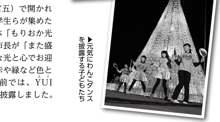
▼元気にわんこダンスを披露する子どもたち