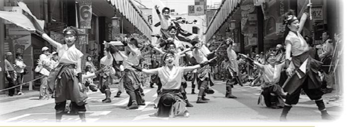
▼元気にわんこダンスを披露する子どもたち