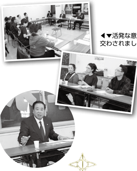
▼活発な意見が交わされました