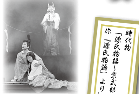
紫式部が執筆中の源氏物語のストーリーとは――

突撃取材 いわて国体への意気込みは？ 市国体ボランティア「モリモリサポーターズ」の皆さんに聞きました in ボランティア団結式（昨年12月8日）