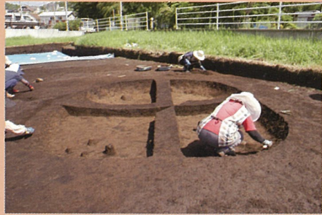
縄文時代前期縦穴建物跡

今回の調査では、縄文時代早期・前期・後期の遺構・遺物を発見しました。調査区中央付近では縄文時代前期の たてあな 縦穴建物跡を確認し、周辺からは いと 繊維を多量に含む土器が出土しました。中央東部では、縄文時代早期前葉から中葉（約8,500年前）にかけての土器・石器が出土しました。南東部では、縄文時代後期の はいせき 配石と どこう 土坑が集中する範囲を確認しました。配石は、1m前後の円形で、内部には火をたいた痕跡を示す焼土があり、配石周辺から見つかった直径60cm前後の土坑内部には、土器や人の頭ほどある大きな石が人為的に埋められていたことから、祭祀的な意味を持つ土坑である可能性があります。