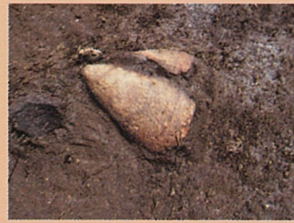
縄文時代早期土器出土状況

これまでの調査で、縄文時代早期～前期を主体とする遺物包含層などが確認されている遺跡です。