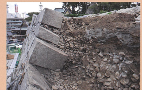
石垣内部状況（三ノ丸）

さらに、本丸地区では、 さんじゅうやぐらだい 三重櫓台上面の追加調査と、本丸南部石土居の いしどい 確認調査を行いました。