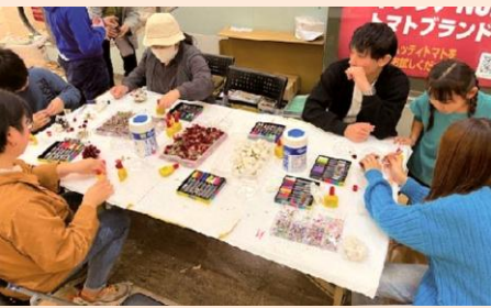
★エコライフイベント