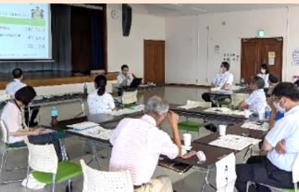
★町内会・自治会活動、地域協働に関する意見交換会