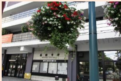
★フラワーバスケット事業