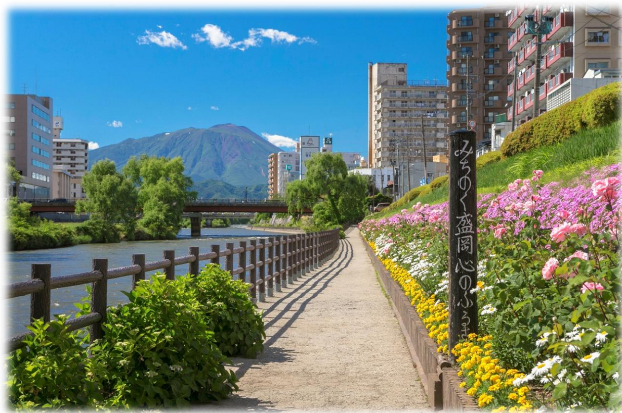
開運橋から見た岩手山