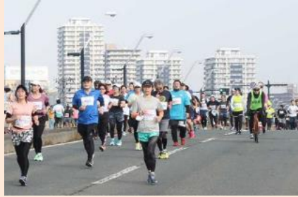
★いわて盛岡シティマラソン