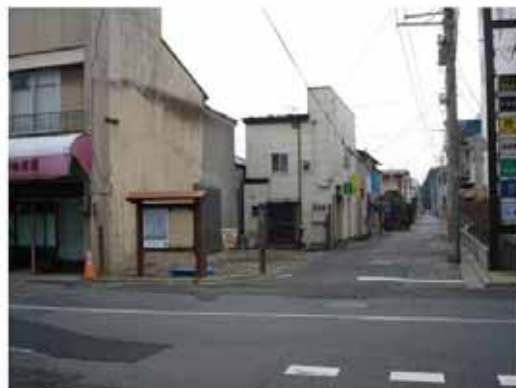
【設置付近の状況(平成20年4月)】