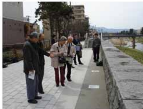
【地元町内会の主催による完成を祝う会】