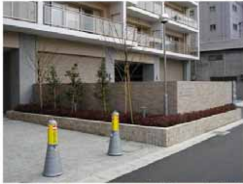
【植栽の状況(平成20年3月)】

・貫通通路沿いに植栽を整備し、都市空間に緑を配し潤いのある空間が創出されました。