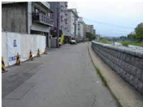
【整備前の状況(平成18年5月)】