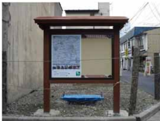
【案内板設置の状況(平成20年4月)】