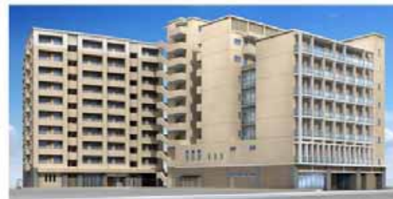
西棟(西岡建設公園側)