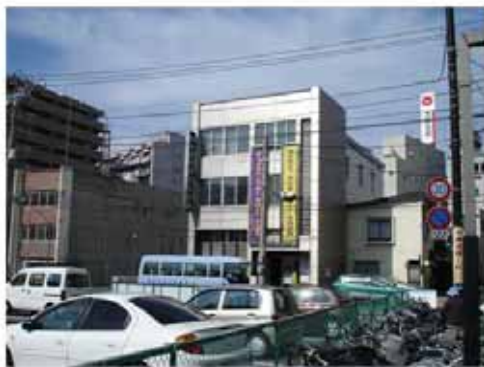
【整備前の状況(平成17年10月)】

肴町三番地区再開発ビルの建設により、分譲マンションのほか高齢者向けの賃貸マンション、老人ホーム並びにデイサービス機能を備えた福祉施設が建設され高齢者のまちなか居住が推進されました。