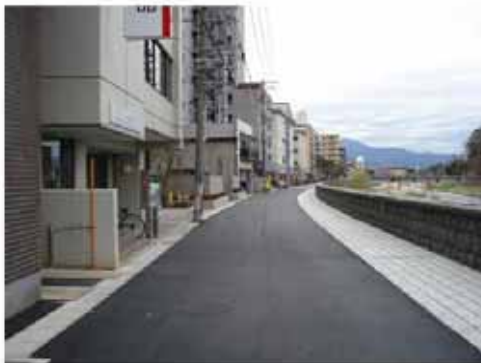
【整備後の状況(平成20年3月)】