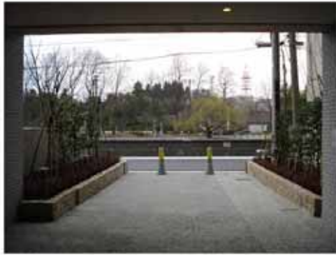
【通抜け通路の状況(平成20年3月)】