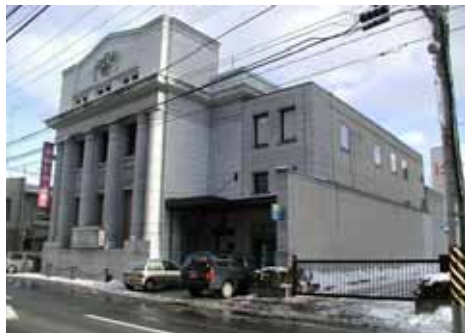
盛岡信用金庫本店