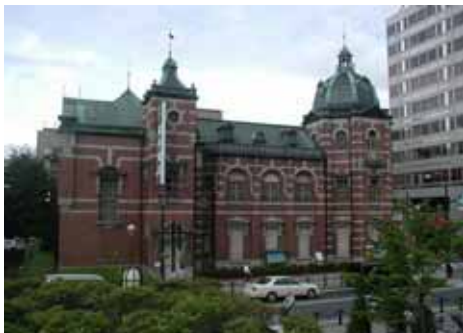
岩手銀行中の橋支店

また、紺屋町番屋のような未使用施設については、今後の活用策を検討する必要がある。