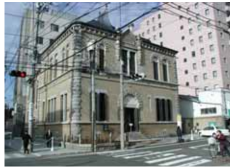
もりおか啄木賢治青春館