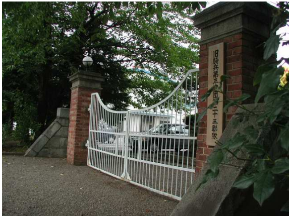
旧騎兵第三旅団通門