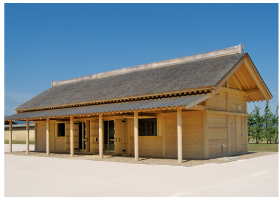
志波城跡官衙建物（復元）