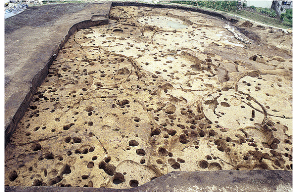
大館町遺跡の竪穴住居跡群