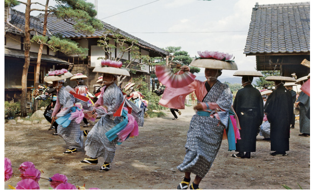
永井大念仏剣舞（国指定無形民俗文化財）