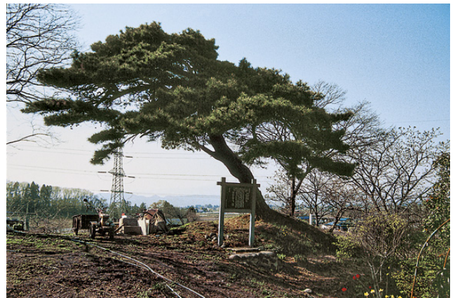
高館古墳（市指定史跡）