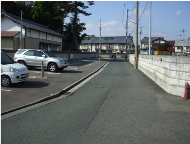
外堀の現況（東頭寺駐車場）