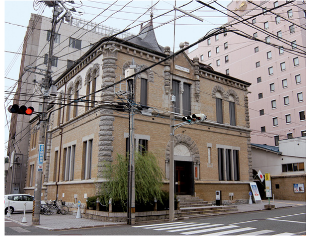
旧第九十銀行本店本館（重要文化財）