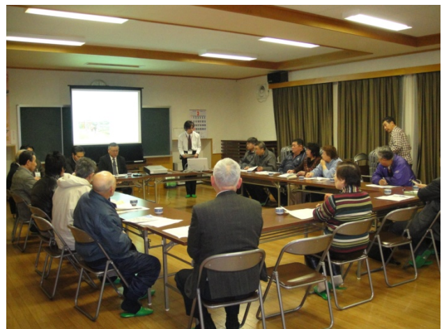
地元説明会の様子（玉山地域）