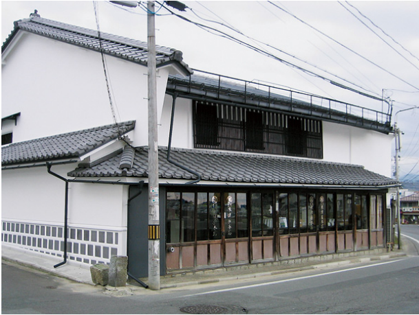
木津屋池野東藤兵衛家住宅（県指定文化財）