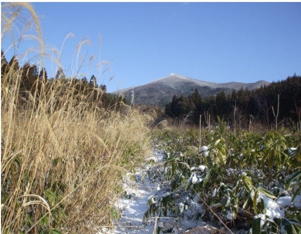
姫神山と筑波寺跡