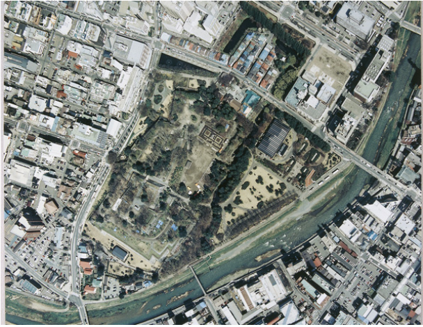
盛岡城跡（国指定史跡）