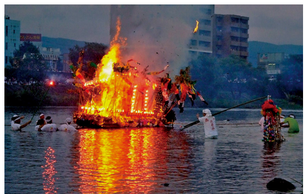
盛岡の舟っこ流し（市指定無形民俗文化財）