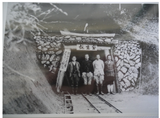
大ヶ生金山（昭和15年ごろ）