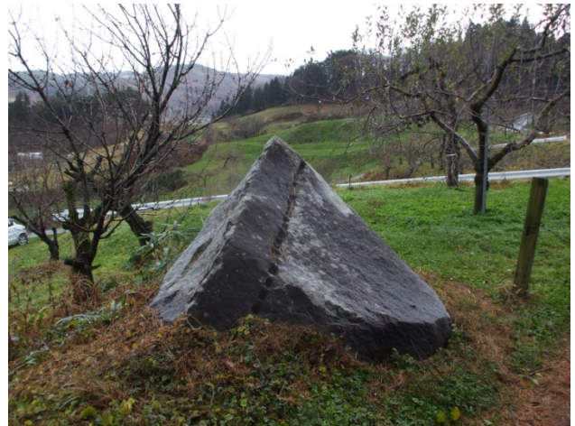
盛岡城石切丁場跡（日蔭山・金勢）