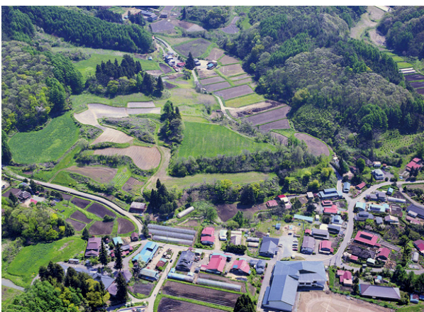
玉山館跡（市指定史跡）