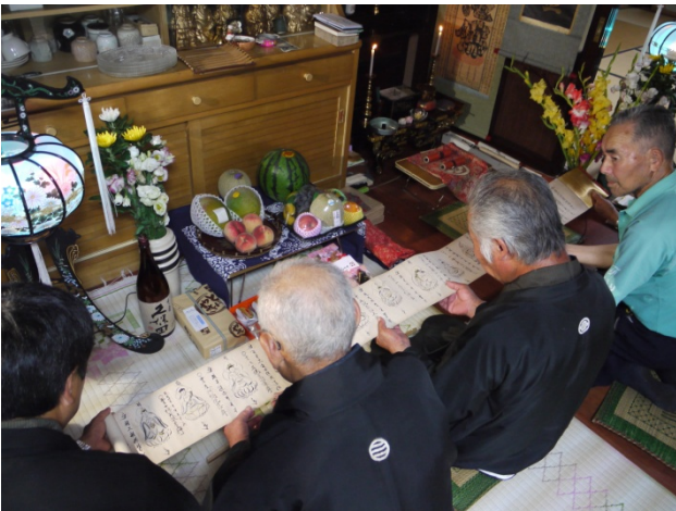
大ヶ生高館剣舞（市無形民俗文化財）の巻物開き