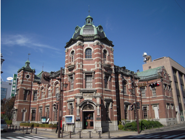
岩手銀行（旧盛岡銀行）旧本店本館（重要文化財）