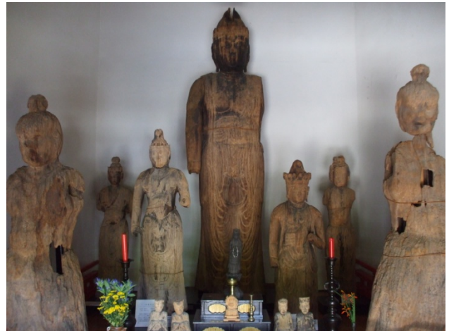
東楽寺十一面観世音菩薩像（県指定文化財）