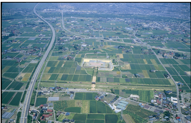
志波城跡（国指定史跡）