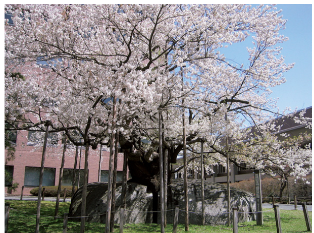
盛岡石割ザクラ（天然記念物）