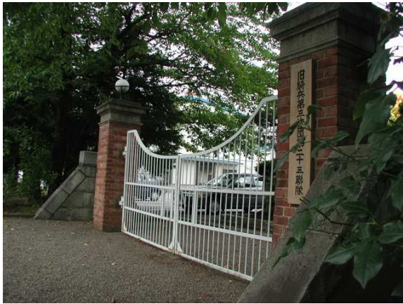
旧騎兵第三旅団通門