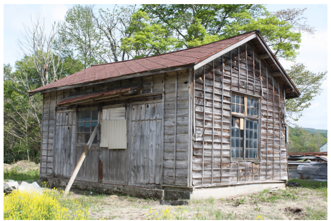
伝岩手県種畜場（外山御料牧場）建物