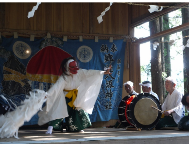
大ヶ生山伏神楽（市無形民俗文化財）