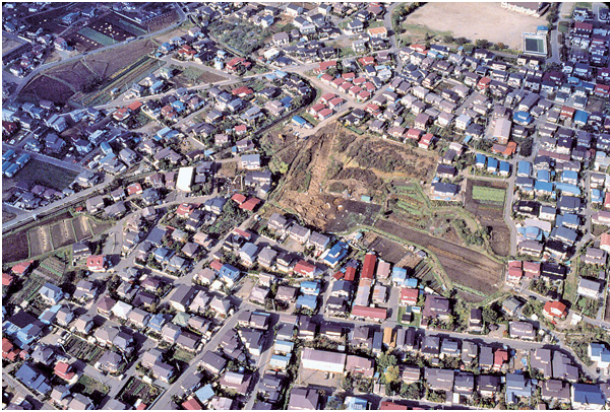
大館町遺跡（県指定史跡）