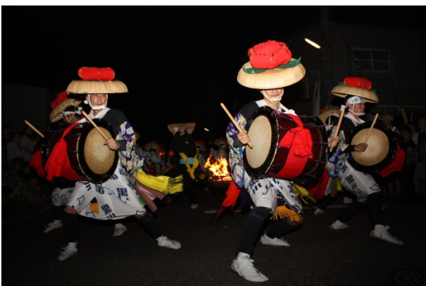
黒川さんざ踊りの門付け