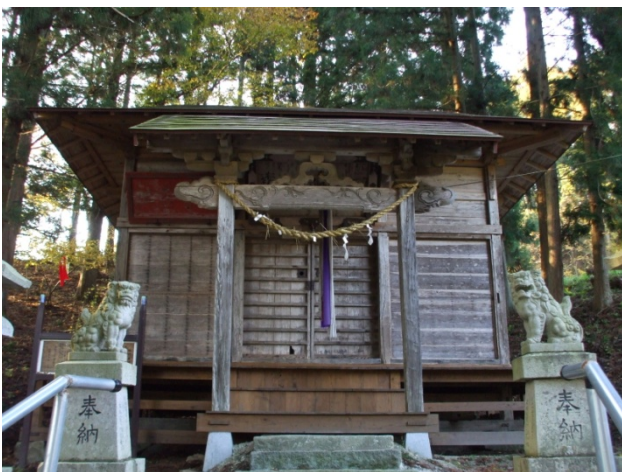
姫神嶽神社拝殿（旧玉山観世音堂）