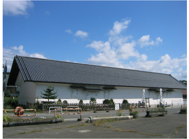
御蔵（市指定文化財）