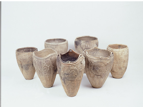
繫V遺跡深鉢形土器（重要文化財）