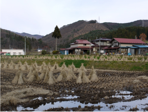
大ヶ生集落の景観