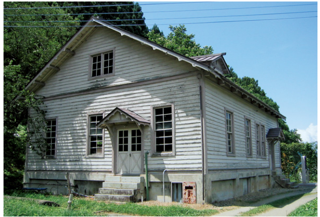
旧宇津野発電所（市指定文化財）