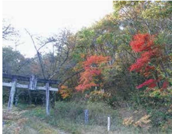
太田薬師神社の参道入口、秋の風景