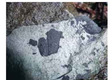
猪去沢地層の葉の化石