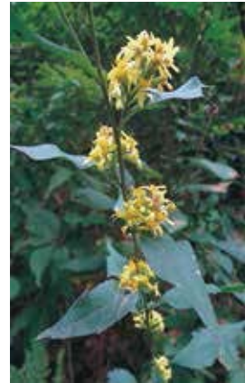
アキノキリンソウ