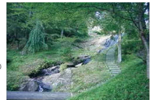
緑と水にあふれる白滝親水公園