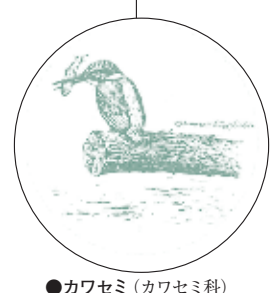
●カワセミ (カワセミ科)