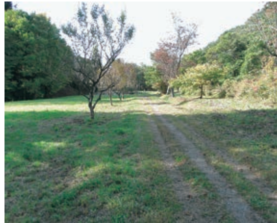
元は牧場であった小鹿公園の散策路

高松の池から鉢ノ皮、小鹿公園を経て、四十四田ダム入口へ。ヨシ原、リンゴ園、落葉広葉樹林、牧場跡と変化に富んだ景色が楽しめるコースです。周囲を丘陵地に囲まれた鉢ノ皮地区は市街地近くにありながら隠れ里のようです。終点からは岩手県立博物館や四十四田公園に立ち寄ることもできます。