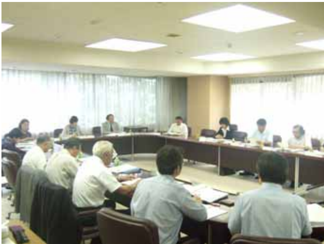
【22.8.4 第1回盛岡市自治体経営推進会議の様子】

市の自治体経営の推進について有識者や市民の方々から意見，提言をいただくため設置した「盛岡市自治体経営推進会議」の第1回の会議が8月4日に開催されました。