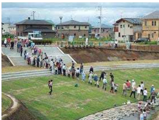
バケツリレーで水を運んでいる様子

そして平成19年7月には、公園づくりの最後の仕上げとして渋民振興会や地元の子供会、NPOなど約200人が参加して、ワンデイチャレンジ( 2 )を行いました。