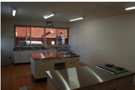
好摩地区コミュニティセンター (改修後)