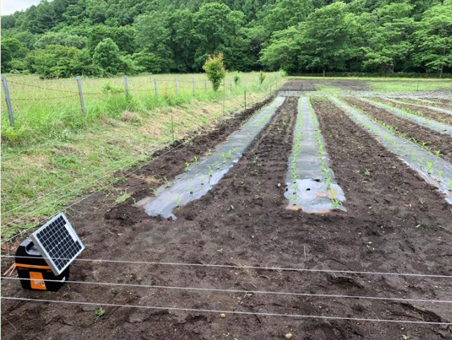
クマ・ハクビシン用の電気柵