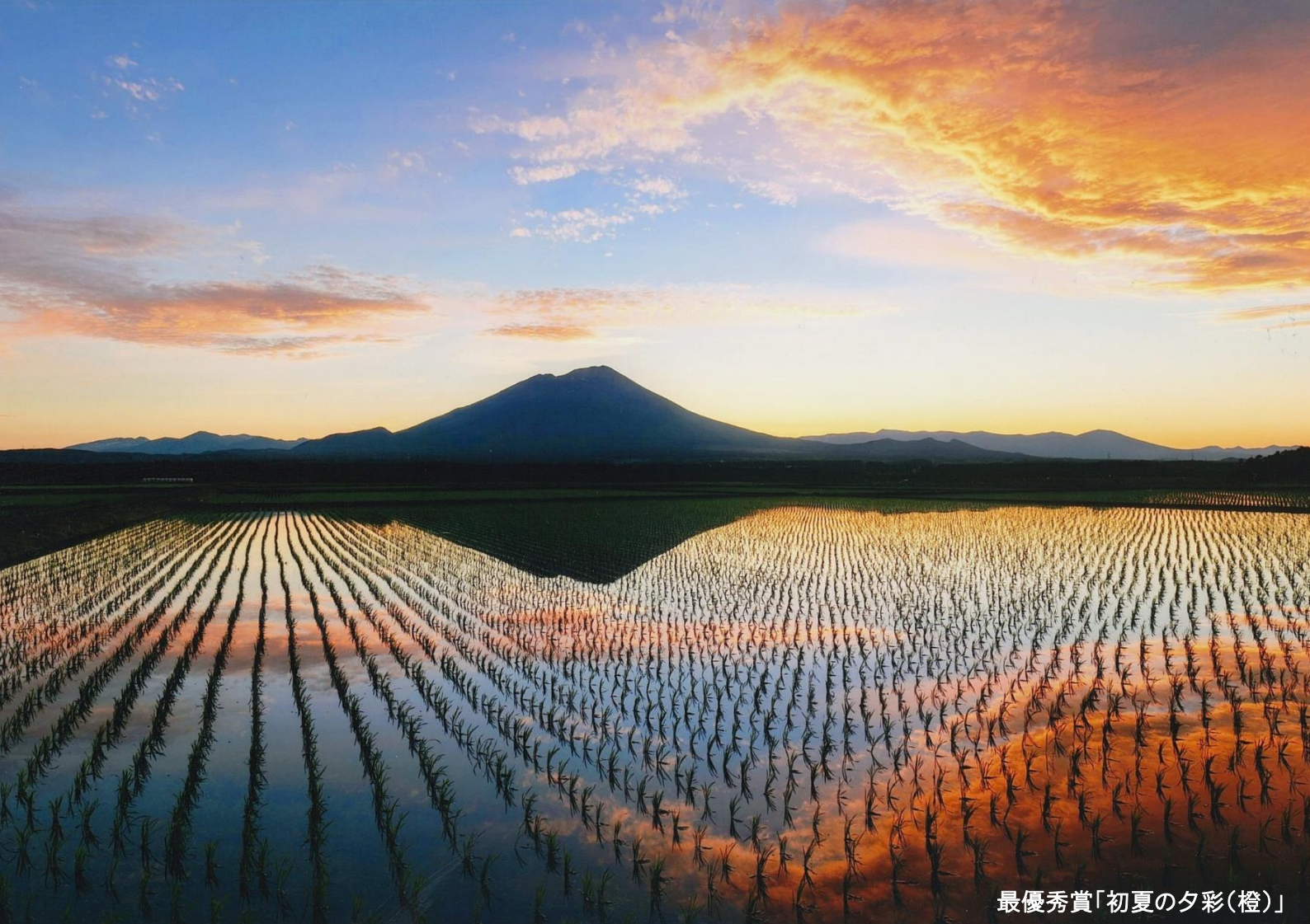
最優秀賞「初夏の夕彩(橙)」