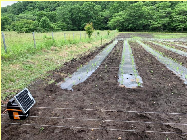
クマ・ハクビシン用の電気柵