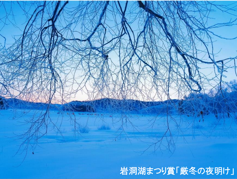
岩洞湖まつり賞「厳冬の夜明け」