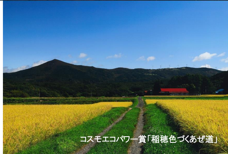
コスモエコパワー賞「稲穂色づくあぜ道」