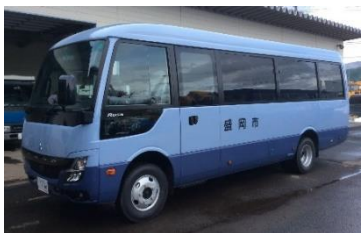
新しい患者輸送バス

山屋沢目、永井沢、生出方面の患者輸送バスは色が白とベージュの2色で、ナンバーが「盛岡 200 さ 45」になりました。