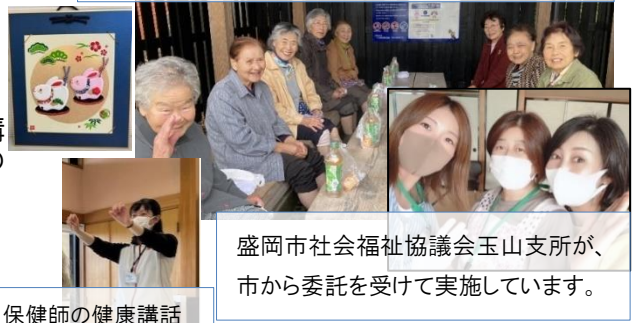
盛岡市社会福祉協議会玉山支所が、市から委託を受けて実施しています。