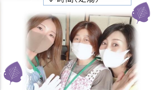
盛岡市社会福祉協議会玉山支所が市から委託を受けて実施しています