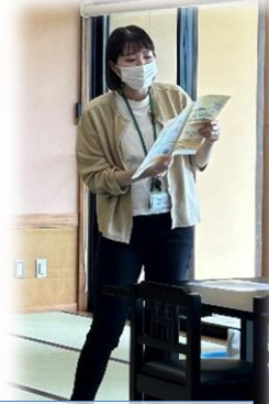
保健師の健康講話