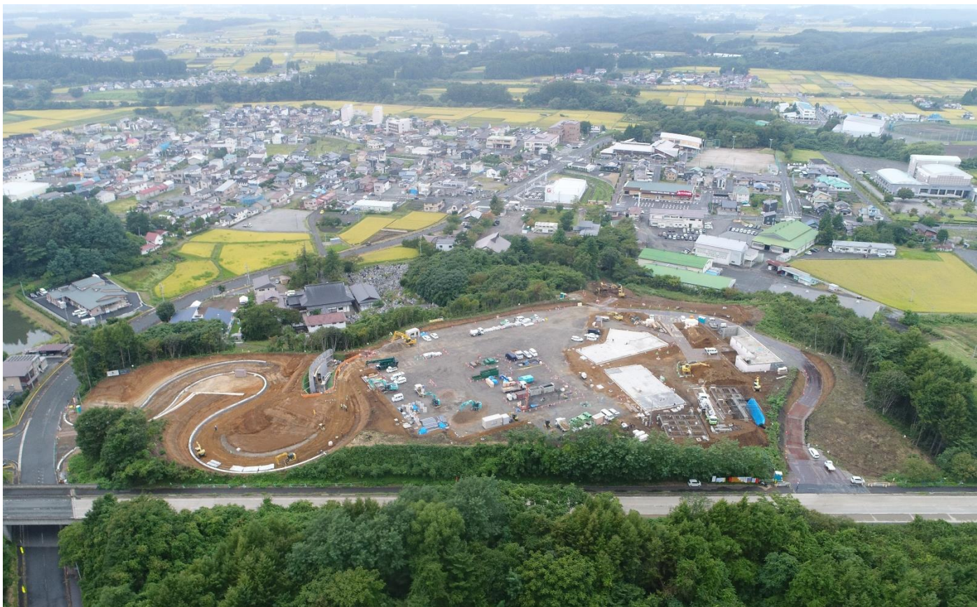
写真は、道の駅建設工事の進捗状況(令和5年9月撮影)