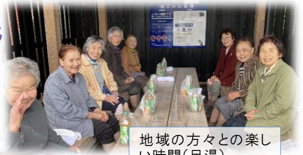
地域の方々との楽しい時間(足湯)