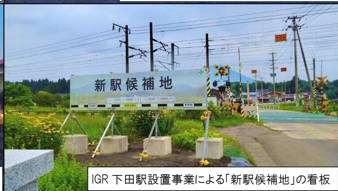
IGR 下田駅設置事業による「新駅候補地」の看板