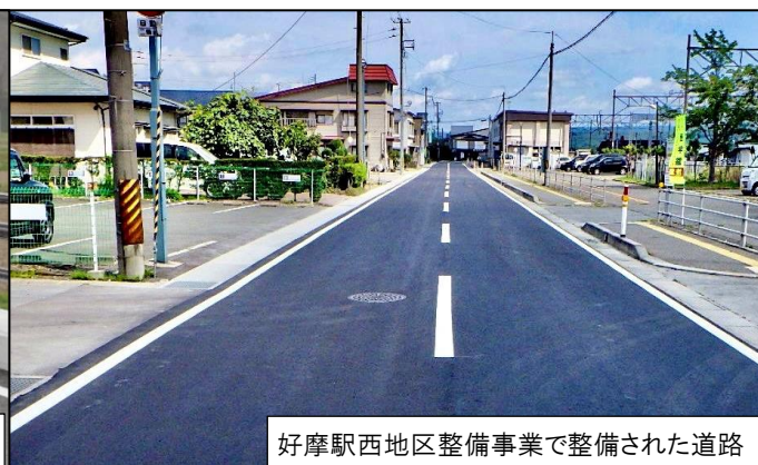
好摩駅西地区整備事業で整備された道路