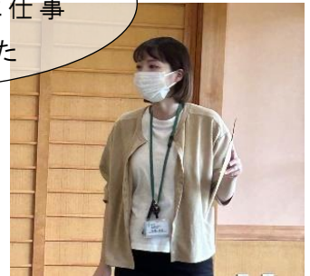
保健師による健康講話も好評です！