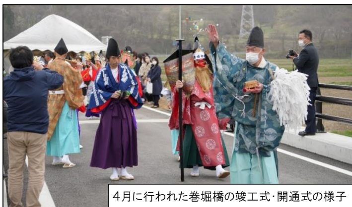
4月に行われた巻堀橋の竣工式・開通式の様子

計画期間内に完了できない見込みのハード事業と継続中のソフト事業の令和7年度以降の取り扱いは、令和6年度中の玉山地域振興会議で報告する予定です。