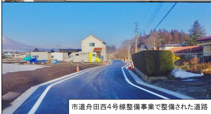
市道舟田西4号線整備事業で整備された道路