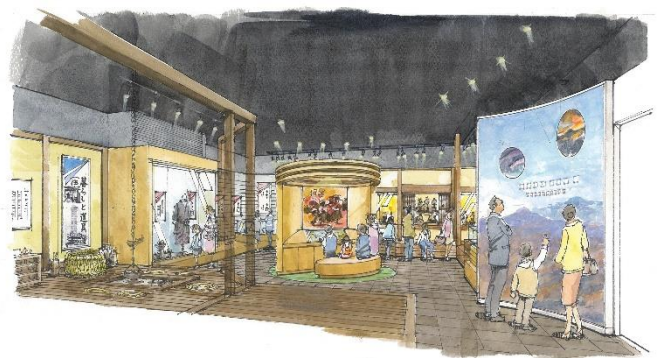
石川啄木記念館(図左)と玉山歴史民俗資料館(図右)のイメージ