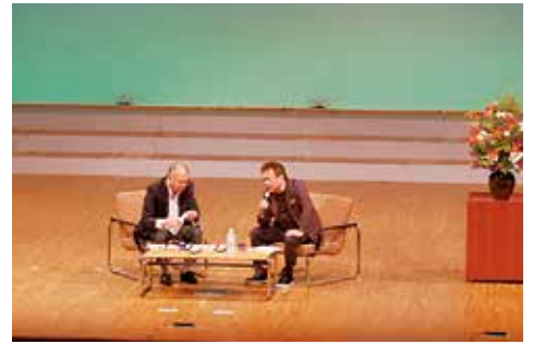
写真は「2017 啄木祭」より

郷土の偉人・石川啄木の業績にちなんだ啄木祭は玉山地域の風物詩。皆様の参加をお待ちしています。