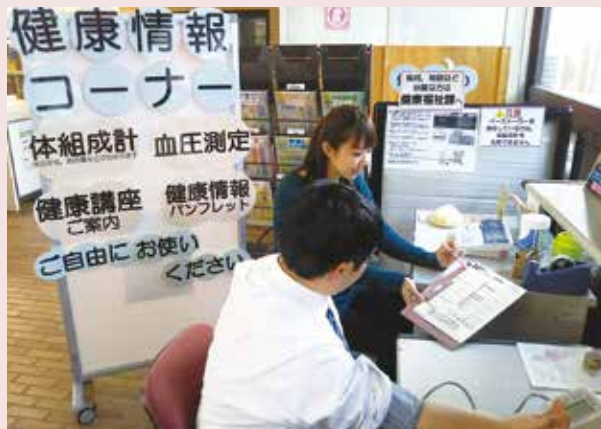
写真は血圧測定と保健師との相談の様子