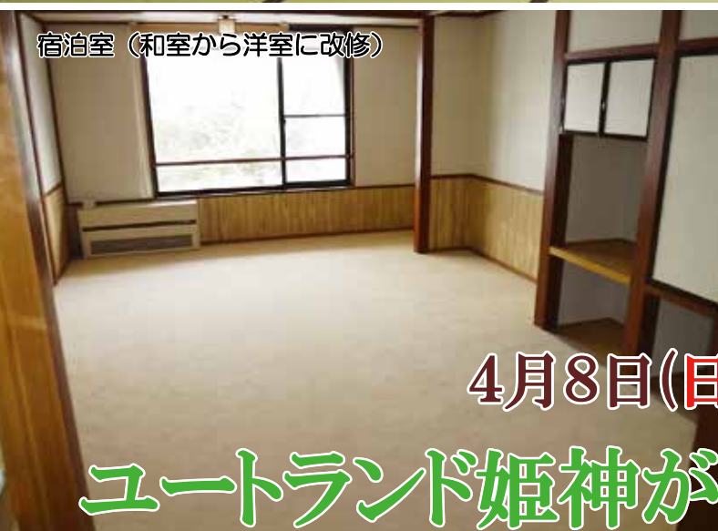
宿泊室 (和室から洋室に改修)