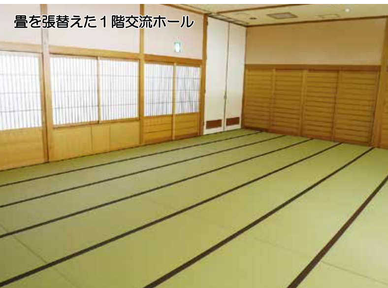
畳を張替えた1階交流ホール