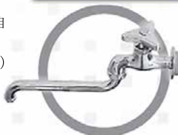
パッキン交換の対象にならない蛇口の例