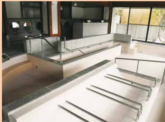
写真はタイルの張替え整備をした浴場

——設置したときの目的は従前のまま変わらないが、内閣府の交付金は地方活性化が趣旨となっているため、従前の目的は尊重しつつ、新たな機能を持たせ活性化を図っていくことと考えている。