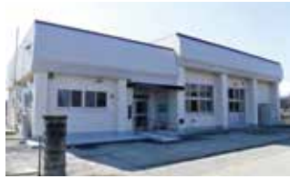
芋田地区コミュニティセンター (改修後)