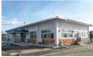
盛岡市農民研修センター (改修後)

30年度、盛岡市農民研修センターと芋田地区コミュニティセンターは、大規模改修工事により、玄関やトイレの段差解消、バリアフリー化などを中心とした機能向上を図るための改修を行いました。