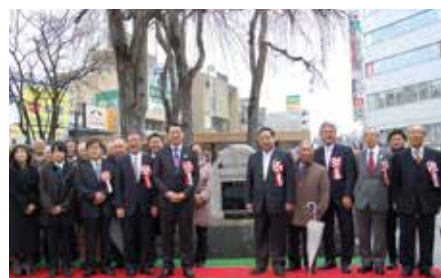
記念碑の除幕式(盛岡駅 滝の広場)