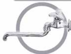
パッキン交換の対象にならない蛇口の例