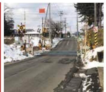
渋民駅北側の踏切

本件については、建設部が担当していることから、次回会議において、担当部署から報告・説明を求めることとしました。