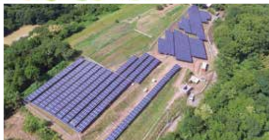
写真：岡山県赤磐市西中

本件については、環境部が担当していることから、次回会議において、担当部署から現在の状況について報告を求めることとしました。