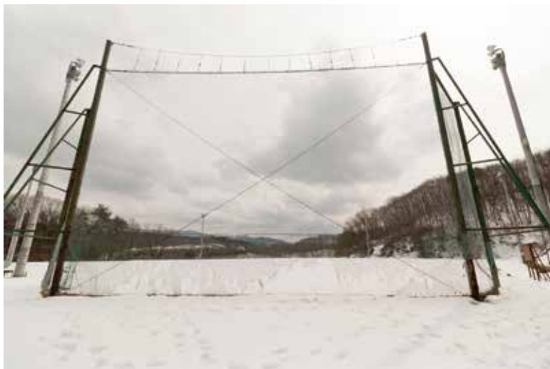
写真は玉山運動場

また渋民野球場は平成29年10月まで現状維持し、利用できない期間が生じないように配慮する。