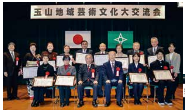
受賞者と主催関係者のみなさん（写真上）と活動発表の様子