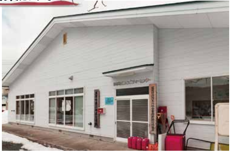
写真は菟川地区公民館