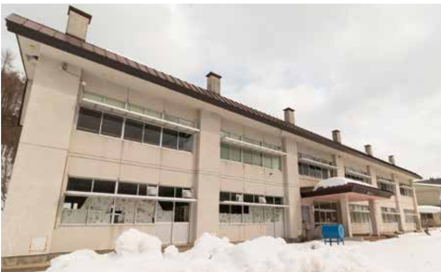
写真は旧外山小学校校舎