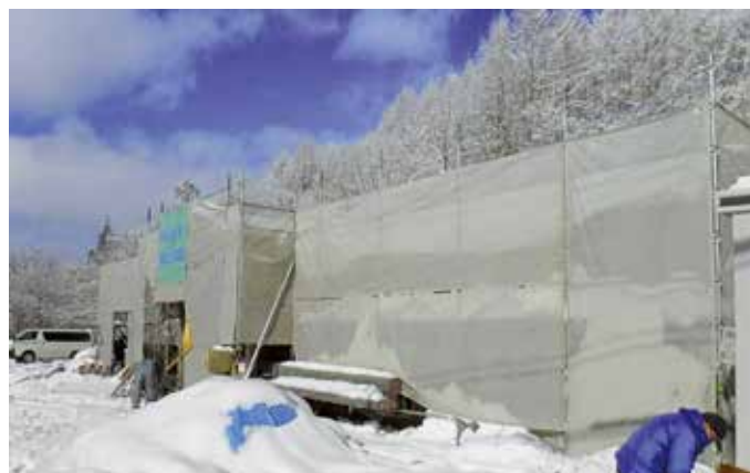
写真は建設中の新薮川地区公民館

地域の声や歴史を踏まえた公民館事業を実施するなどにより、多くの市民が集うような施設となるよう創意工夫を図ること。