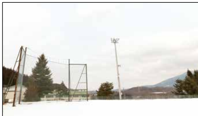
写真は玉山運動場