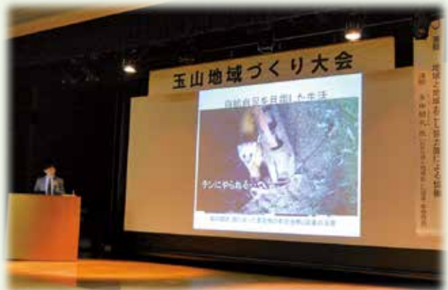
写真は基調講演の様子

平成22年度に新潟県十日町市の地域おこし協力隊員となり、限界集落だった池谷集落に家族で移住。任期終了後はNPO法人を立ち上げ、都会から田舎への移住支援や田舎での起業支援研修の開催、総務省の地域力創造アドバイザーを務めるなど地方創生の分野で幅広く活動している。