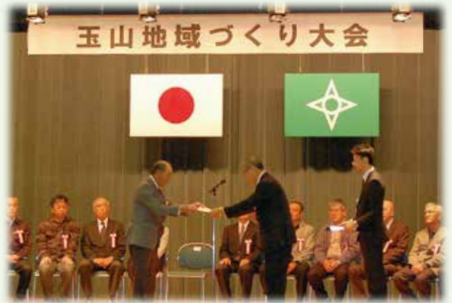
写真は表彰状授与の様子