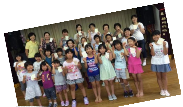
YUI FITNESS KID'Sの皆さん