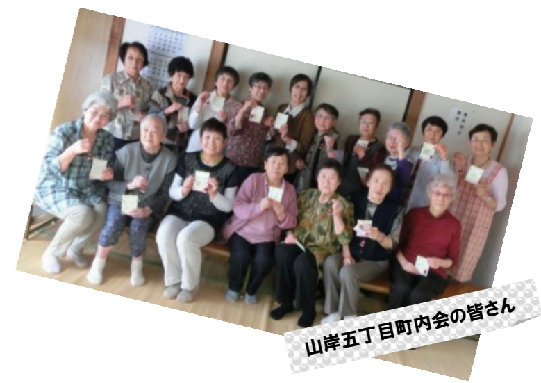
山岸五丁目町内会の皆さん