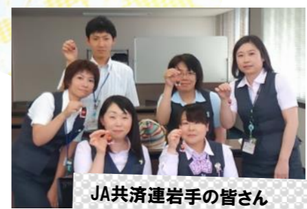
JA共済連岩手の皆さん

団体名と代表者の連絡先、希望日程、会場、参加人数などをお聞きしたうえで、制作にかかる段取りのご説明を含め、詳細は打ち合わせをさせていただきます。