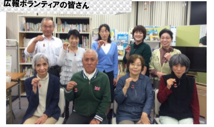
もりおか復興支援センター利用者と 広報ボランティアの皆さん