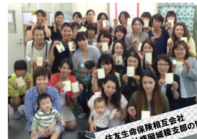
住友生命保険相互会社 盛岡支社盛岡城種支部の皆さん