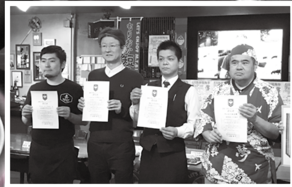
写真：肉・卵部門の認定式の様子

盛岡あつがるぱん、盛岡りんごパイ、盛岡りんごのデクリネゾン、もりおか短角牛ロースステーキ三陸うにソース、牛すじ煮込み