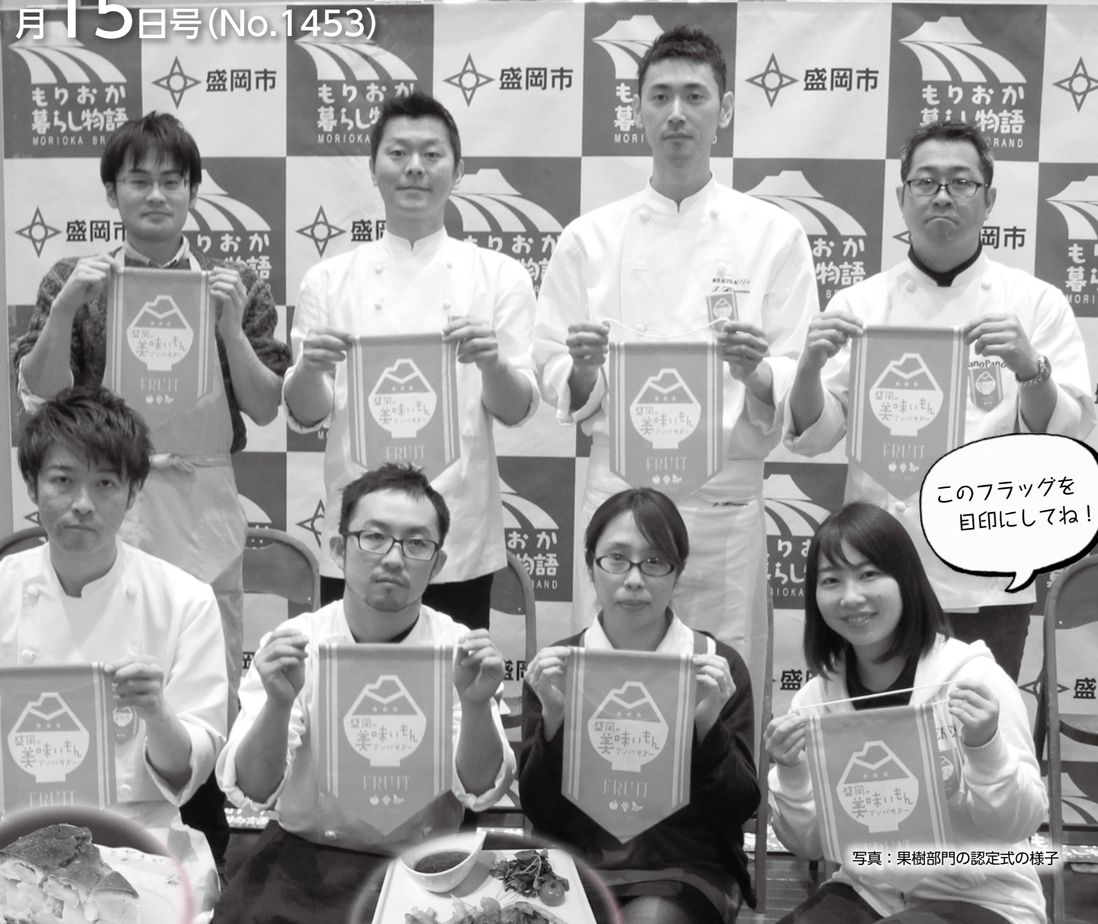
写真：果樹部門の認定式の様子