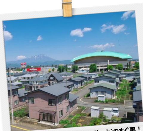
盛岡タカヤアリーナ(市アイスアリーナ)のすぐ裏！ スーパーも近くにあって便利♪