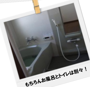
もちろんお風呂とトイレは別々！