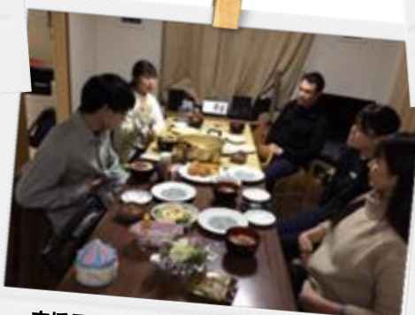
支援員さんとの『ごはんの会』。皆で楽しくお食事会です☆