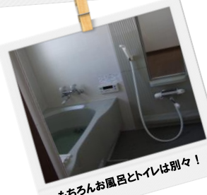
もちろんお風呂とトイレは別々！