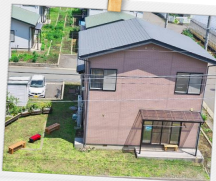
シェアハウスでの新しい学生生活を始めてみませんか？お気軽にお問い合わせ下さい！