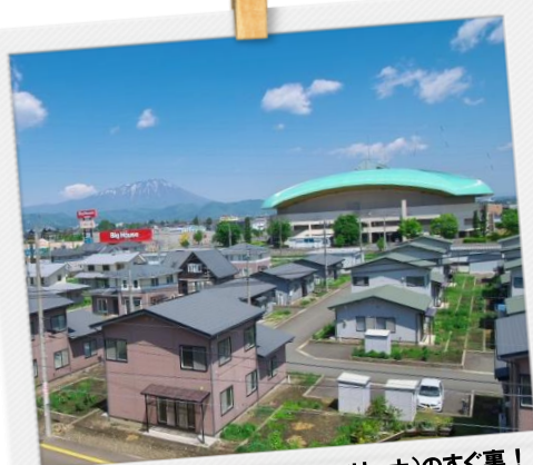
盛岡タカヤアリーナ(市アイスアリーナ)のすぐ裏！スーパーも近くにあって便利♪