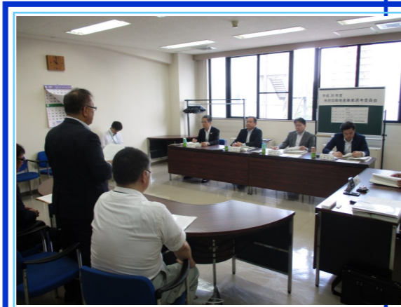
選考委員会の様子

JR岩手飯岡駅西口ロータリーを整備し“いわぎんスタジアム”を訪れる観客のおもてなし拠点にするとともに、「おもてなし看板」を活用した情報発信事業や、花壇の整備・管理事業等を行う。