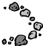
矢印の方向に進め