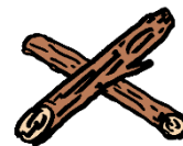
進んではいけない