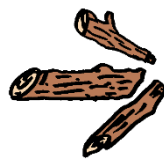
矢印の方向に進め