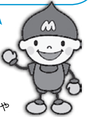
上下水道局マスコット キャラクター水道ぼうや

水抜栓の半開きや中途半端な操作は、凍結や漏水の原因。水を抜くときも使うときも、水抜栓の開閉をしっかりすることが大切です