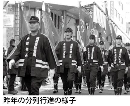
昨年の分列行進の様子

① 1月6日(日) ▶ 式典：10時半～、盛岡城跡公園(内丸) ▶ 分列行進：11時～、サンビル(大通一)から映画館通りの交差点まで ID 1024817