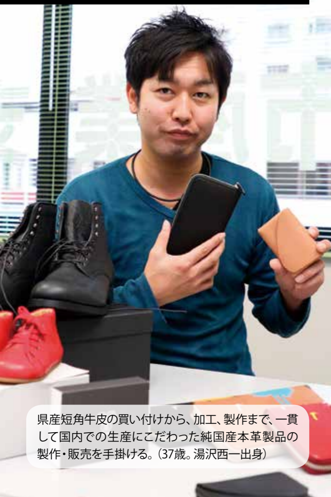
県産短角牛皮の買い付けから、加工、製作まで、一貫して国内での生産にこだわった純国産革製品の製作・販売を手掛ける。(37歳。湯沢西一出身)