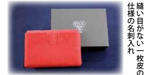
縫い目がない一枚皮の名刺入れ

紅葉が丘36番21号 ☎613-5130 ホームページ http://www.iwatagawa.jp/