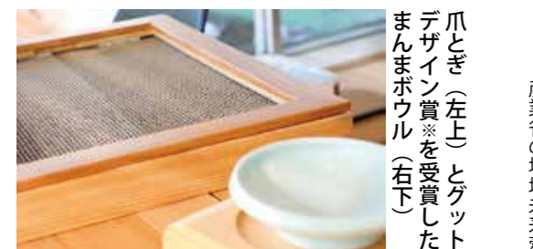
※日本デザイン振興会主催のデザインが優れた物事に贈られる賞。まんまボウルは、ネコの行動を観察し、食べやすいよう手を低くした設計などが評価された

意。伝手も経験もないので、電話帳で調べて、作ってくれそうな工房に片っ端から電話しました。ようやく見つかった1社と試行錯誤し、猫にとっての使いやすいなど「ネコ目線」を重視した製品が完成。ブランド化して販売を始め、今では、お客さまの声も反映した製品数は30種類以上になりました。これからは病気予防などネコの健康を第一に考えた製品に力を入れていきたいですね。世の中の困りごとを自分で解決できるのが起業の魅力！失敗したら修正して、また進めばいい。とりあえず動いてみるのが大切だと思います。