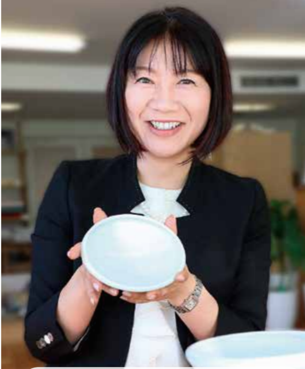
ネコの健康を守ることを使命と考え、ネコにとっての使いやすさを最優先に、こだわった製品開発を手掛ける。(41歳。津志田21出身)