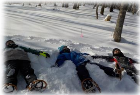
【雪の上で大の字になる参加者】