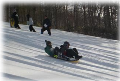
【広々としたゲレンデを滑る参加者】