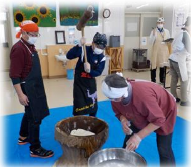
【上手にもちをついています】