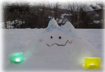
【参加者が作った可愛い作品】

参加した方からは、「親子でみずきだんごの形を相談したり、工夫したりしながら作ることができて良かった。」「今回初めて参加して、子どもと大変楽しい時間を過ごすことができました。」などの感想をいただきました。どちらの事業もボランティアの協力を得て、楽しく安全に実施することができました。