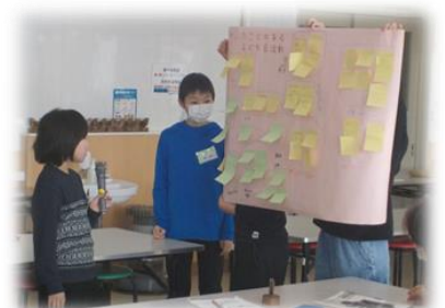
【話し合われた内容を発表しました】