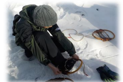
【初めて輪かんじきを履く参加者】