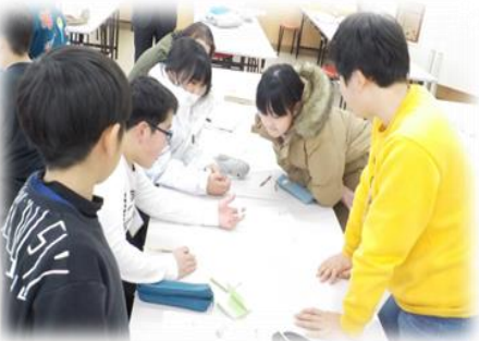
【お互いの意見を交流する参加者】

1日目は、始めに「子ども会で生かせるゲーム」を行い、初めて会う仲間と交流しながら、皆が楽しめるゲームを実体験しました。次に、活動するための「組織づくり」と「子ども熟議(理想の子ども会活動を考えよう)」を行いました。熟議の中では、『子ども会活動を行うと、どんな良いことがあるのか』や『リーダーとして気をつけなければならないこと』などを交流し、考えていきました。