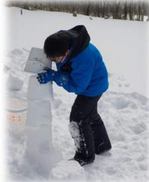
【雪上ゲームをする参加者】

2日目は、野外活動として、「輪かんじきハイク」「そり滑り」「雪上ゲーム」(選択制)に分かれて体験しました。