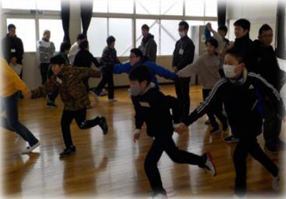
【子ども会で生かせるゲームを体験しました】

2月10日(土)～11日(日)1泊2日の日程で、当自然の家において「子ども会リーダー研修会①」(参加者18名)を開催しました。