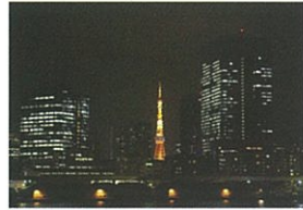
1 19:20頃 竹芝エリア/東京タワー