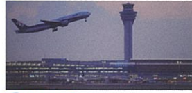
4 20:00頃 羽田空港