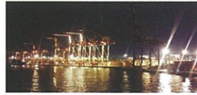
3 19:45頃 大井コンテナ埠頭

東京湾納涼船の最新情報をお届け https://twitter.com/nouryouusen https://www.facebook.com/nouryouusen https://www.instagram.com/nouryouusen/