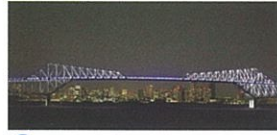
5 20:15頃 東京ゲートブリッジ