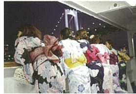
2 19:25頃 レインボーブリッジ

東京湾納涼船の最新情報をお届け https://twitter.com/nouryouusen https://www.facebook.com/nouryouusen https://www.instagram.com/nouryouusen/