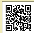
大会ホームページ