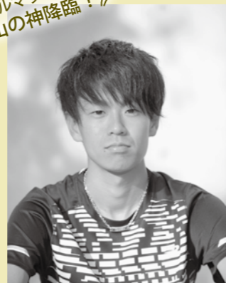
かみの だいし 神野大地さん

青山学院大3年生のとき、箱根駅伝5区で区間新記録を樹立し、「3代目山の神」と称される。卒業後は実業団を経て、平成30年5月からプロランナー(セルソース所属)として活動中。1993年、愛知県生まれ。