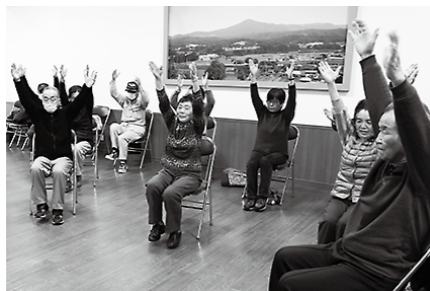
過去の教室の様子

☎☎☎ 表2のとおり※65歳以上 ☎無料※会場により保険料がかかる場合があります ID 1003803