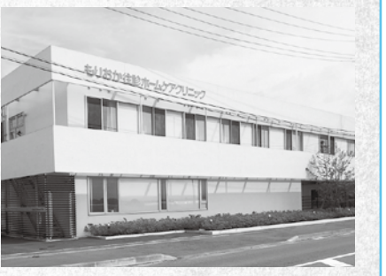
もりおか往診ホームケアクリニック(北飯岡三丁目)

鉈屋町の入り口にある明治時代の蔵をリノベーションし、ゲストハウスとした2階建の建物。蔵の印象をそのままに、庇や看板などの配置が街並みと調和し、足を止めてホッと一息つきたくなるような空間を創り出しています。