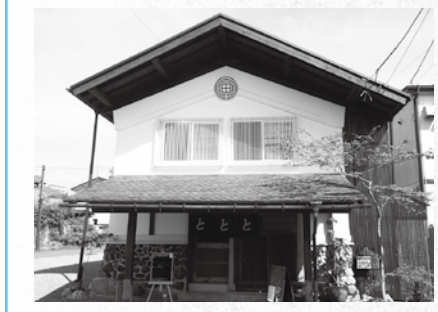
鉈屋町のゲストハウス(鉈屋町)

市は、34件の応募の中から本年度の都市景観賞として2件を決定しました。【問】景観政策課☎601-5541