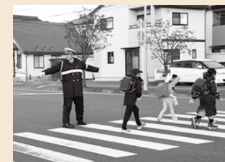
通学児童見守り活動の様子