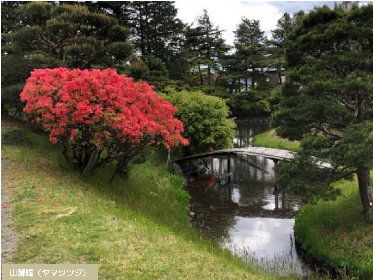
山躑躅（ヤマツツジ）