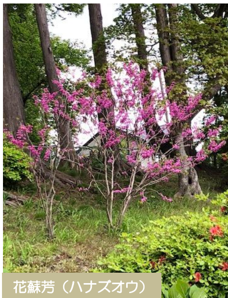
花蘇芳（ハナズオウ）