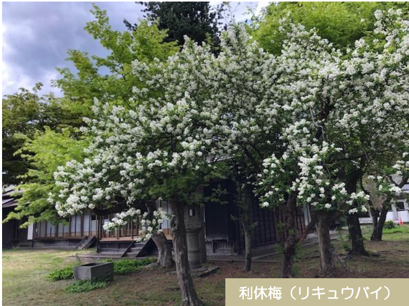
利休梅（リキュウバイ）