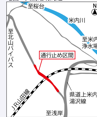
地図 大誘踏切周辺