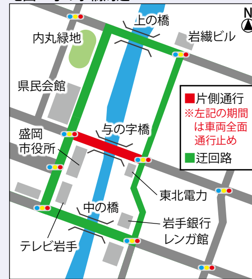
地図 与の字橋周辺