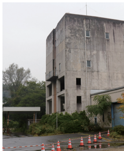
安全・安心な解体工事の実施を

答 粉じんを湿潤化した上で、養生シートと集じん装置を使用し有害物質の飛散防止を図るとともに、防音シートや低振動機械を使用して防音対策を行う。地域住民へはチラシを配布して情報提供しており、解体工事終了まできめ細やかに対応していく。