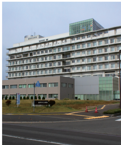
市民の声を反映させた事業運営を

答 2年4月現在で11人欠員だが、再試験により10月に複数人採用見込みである。採用年齢の上限引き上げや、柔軟な働き方のための体制を整えつつある。未利用地は市民に役立つ活用方法が最重要であり、サウンディング型市場調査などにより意見を聴取し進める。