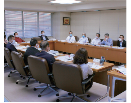
コロナ禍を乗り越え経済の持続を

8月11日に、「気候非常事態宣言」を求める請願（2年6月定例会継続審査）について、請願者から趣旨の説明を受けました。また、8月20日には盛岡商工会議所との意見交換会を開催しました。「新型コロナウイルス感染症による市内経済への影響について」をテーマに、商工会議所が実務を行うプレミアム付商品券などの緊急経済対策について説明を受けた後、市の支援策と国のGoToキャンペーンとの関係や、盛岡の宿応援割事業などについて意見交換を行いました。