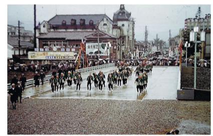
9代目・中の橋開通式 1957 (昭和32)年 01/31