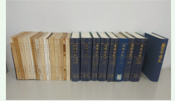
過去に刊行した盛岡市史・通史

ん事業では、これらの市史・村誌の編さんの成果を踏まえ、その後の時代を切れ目なく網羅できるよう、おおむね昭和30年代から平成の終わりまでの約60年間を対象期間とし、昭和20年代の戦後の新たな時代背景なども加えながら、新たな市史として通史編・資料編・写真集の編さんを進めてきました。