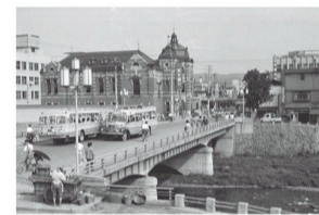
28 盛岡市史現代 写真集