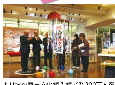
もりおか歴史文化館入館者数200万人突破 (2月16日)