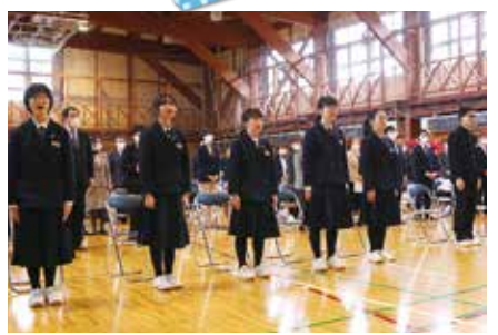
市立繫中学校開校 (3月31日)