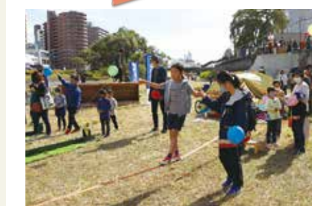
木伏緑地1周年記念イベント (10月17日)