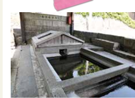
青龍水の使用が再開 (8月31日)