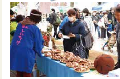
市農業まつり (10月24日)