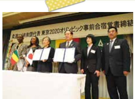
柔道マリ共和国代表 東京2020オリンピック事前合宿覚書締結 (1月21日)