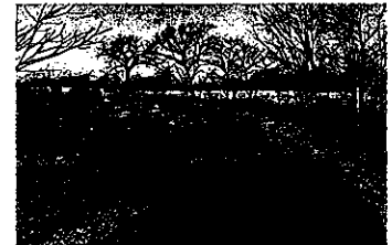
太田グラウンド接続道路の改良(砂利の敷設)

「盛岡市少年専用球場(太田橋グラウンド)」の駐車場までの接続道は轍があり、走行が困難なほどでした。そこで現地に赴き、問題の重要性を市に訴え、所管の交流推進部と道路管理課に改良を訴えたところ、12月4日に砂利を敷設する運びとなりました。これからは、安心して野球場へアクセスできます。長年の懸案事項を解消することができました。