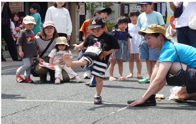
▲雪駄飛ばし世界大会(児童の部)の様子