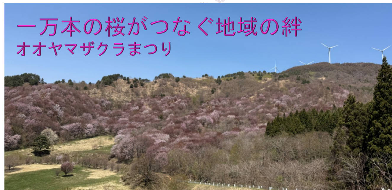
▲サクラパーク姫神 咲き誇るオオヤマザクラ

4月26日(日)、日戸キャンプ場(日戸字新田地内)で「オオヤマザクラまつり2026」が開催され、約1,200人の来場者で賑わいました。