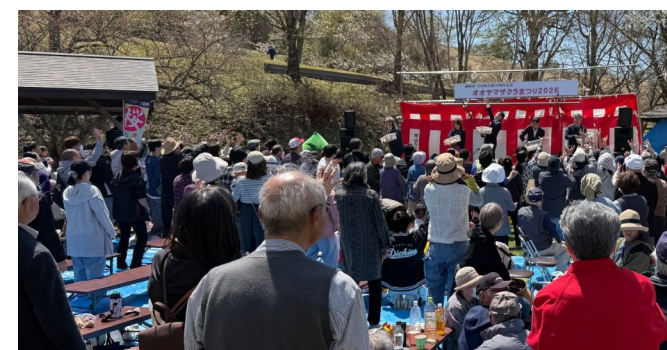
▲もちまきを楽しむ来場者

ふるさとを思う気持ちで守り育てられてきた満開の桜が、訪れた人々を楽しませていました。