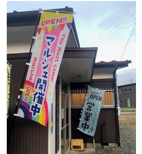
▲マルシェ開催中の名乗町内会公民館