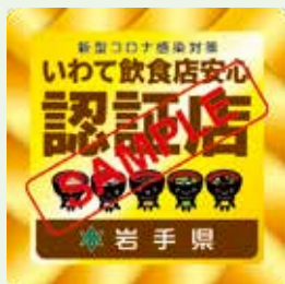
「いわて飲食店安心認証店」の認証マーク

利用者が安心して飲食できるよう、飲食店が実施する感染対策を県が認証するものです。認証店の一覧など詳しくは、県ホームページをご覧ください。