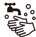
石けんによる 手洗い