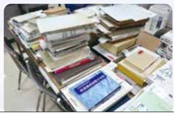
収集した資料を再確認し、どのように執筆していくかを日々研究しています