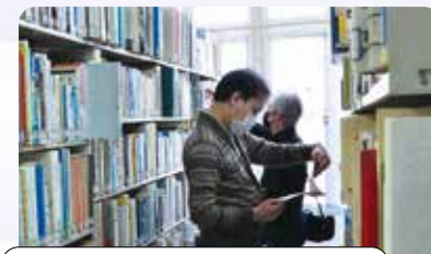
4日間で約200冊の図書資料を確認・借用しました