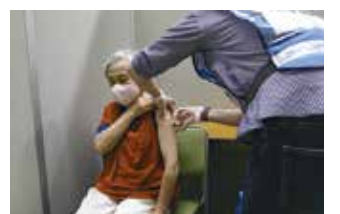
市のワクチン集団接種の様子▶