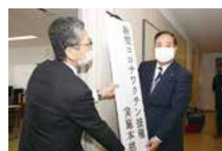
新型コロナワクチン接種実施本部を設置